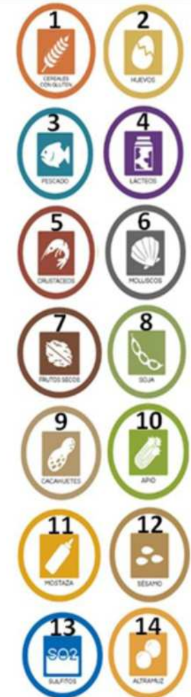
LEYENDA DE ALÉRGENOS